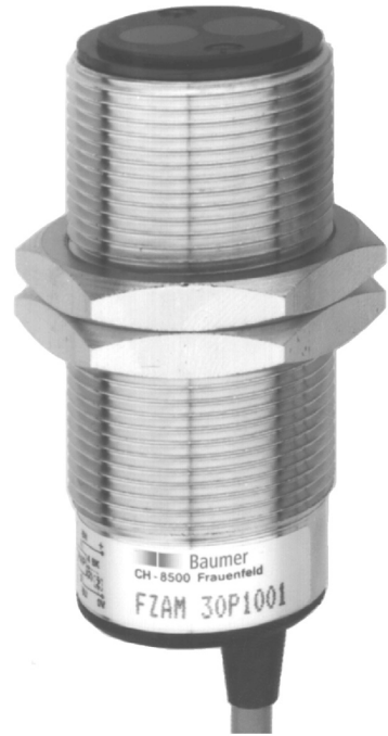
图片与实际产品类似